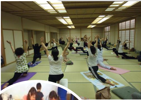
高知ヨーガ研修会

高知市立中央公民館を拠点に自主的に生涯学習活動を行う団体で、一定の要件を満たした団体は、高知市立中央公民館生涯学習サークル（通称「中央公民館サークル」）として登録していただくことにより、 使用料が5割減額 になります。