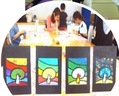
こうち美術サークル