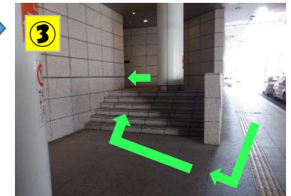
③ 階段を上ってください