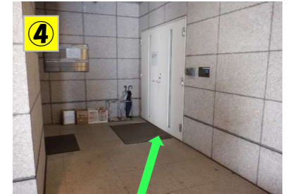
④ 入口：ドアを開けてお入りください