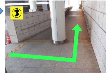
スロープを上がってください