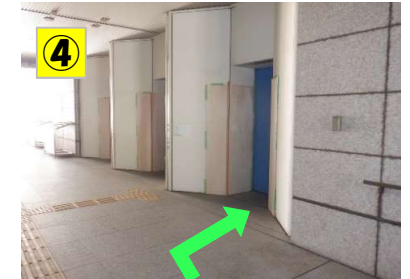
手前のエレベーターをご利用ください